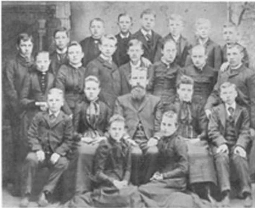
Die Konfirmierten - 1892